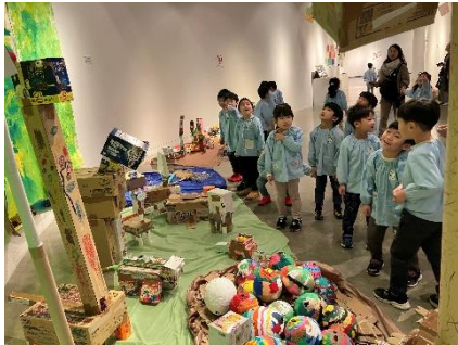
あすわのこども展見学