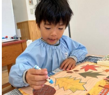
絵本の製作 (色塗り)