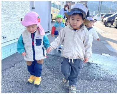
散歩 (お友達と手を繋いで)